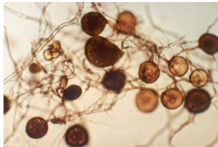
Reinkultur symbiontischer Pilze zur Bodenverbesserung